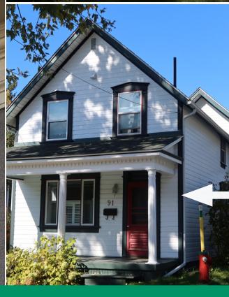
Planche verticale qui couvre l'angle de deux murs extérieurs. Elle sert d'élément décoratif en plus d'empêcher l'infiltration de l'air et de l'eau.